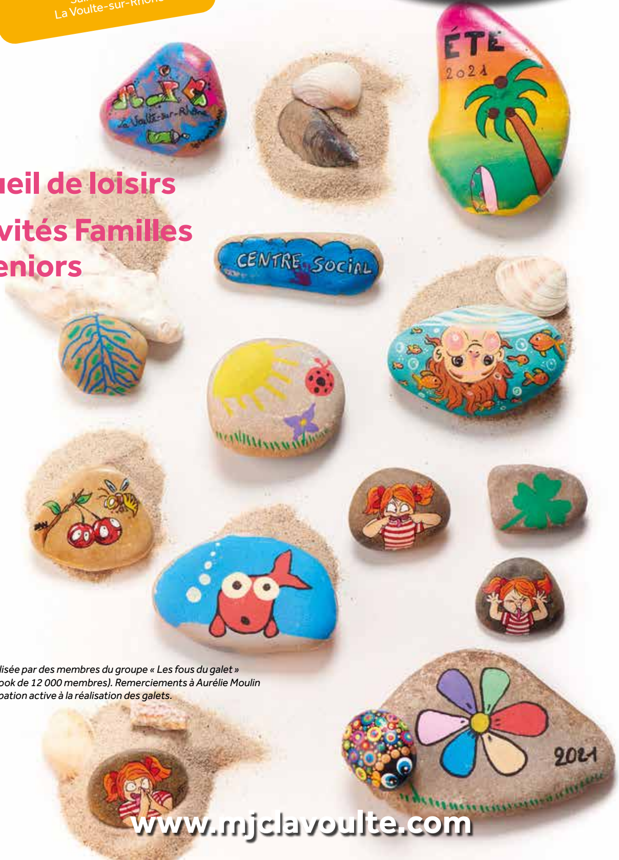
Illustration réalisée par des membres du groupe « Les fous du galet » (groupe Facebook de 12 000 membres). Remerciements à Aurélie Moulin pour sa participation active à la réalisation des galets.

Accueil de loisirs Activités Familles et Seniors