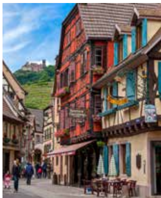
Programme sous réserve de modifications.