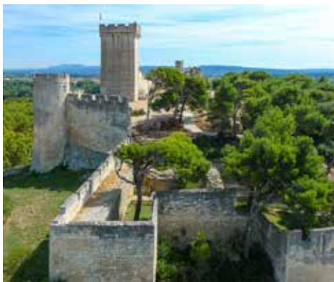
Programme sous réserve de modifications.