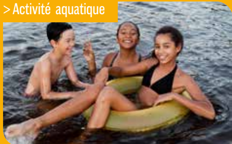
Repas à la cantine