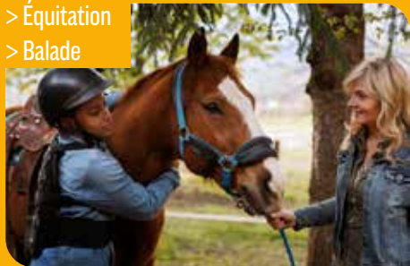
Pique-nique de la cantine